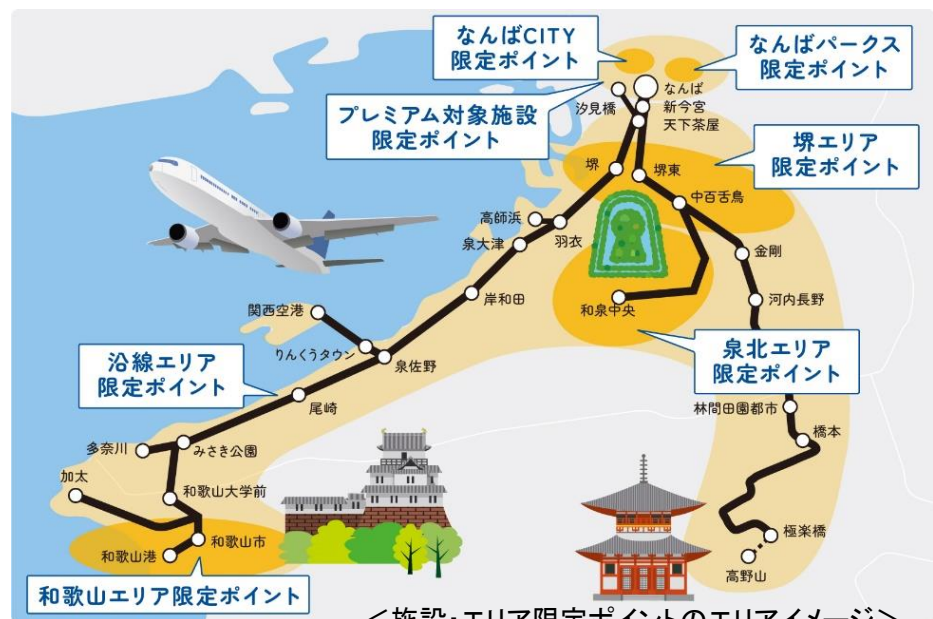
<施設・エリア限定ポイントのエリアイメージ>